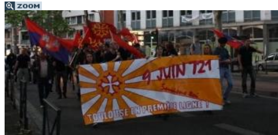
Des membres du Bloc identitaire ont manifesté vendredi soir.

Officiellement, c'est une cinquantaine de membres du Bloc identitaire, association d'extrême droite, qui ont participé, vendredi en fin de journée, à une manifestation. Munis de fumigènes et de drapeaux occitans, scandant « Tolosa reconqu Coastat » et « L'identité, elle est à nous », ils se sont rendus jusqu'au Monument aux morts pour célébrer la victoire du duc Eude d'Aquitaine sur des musulmans arrivés aux portes de Toulouse. Une manifestation déclarée auprès des services de la préfecture. Cette